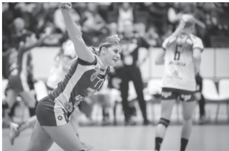
A vasárnapi eredménnyel a román csapat a második helyről kvalifikál.

Hatgólos győzelmet aratott vasárnap este hazai pályán a Bukaresti CSM az FC Midtjylland ellen a női kézilabda Bajnokok Ligája C csoportjában.