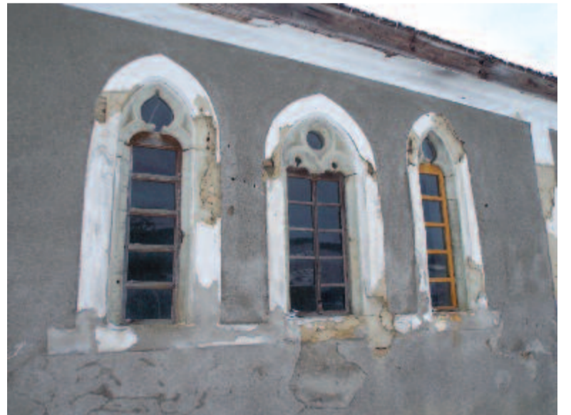
Gótikus ablakkeretek málló vakolattal