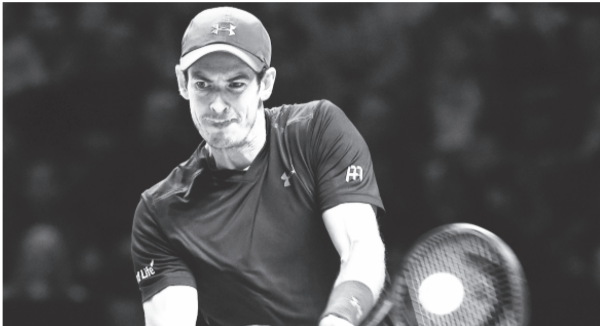
A döntő különlegességét adta, hogy – a sportági történelemben először – a szezon utolsó meccsén derült ki az év végi világső személye

Ami a pénzdíjakat illeti, a veretlen világbajnok 2,391 millió dollárt kap, bónuszként pedig hárommilliót a világsőségért, azaz 5,391 millióval gazdagodik. A vesztes 1,261+1,5, azaz 2,761 millióval viasztaalódhat. A nyolcfős, szezonzáró szupertornának az O2 Arena adott otthont.